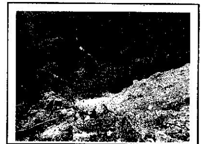
大洞ダム上部崩落箇所