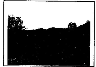
尻無の頭山頂付近